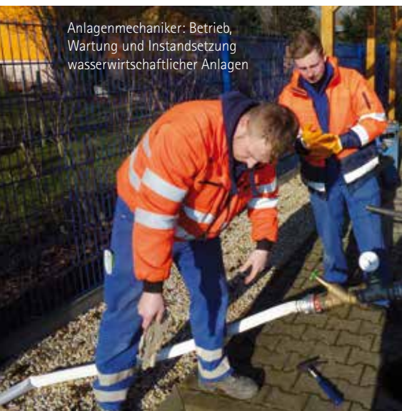
Anlagenmechaniker: Betrieb, Wartung und Instandsetzung wasserwirtschaftlicher Anlagen

ZERTIFIZIERUNGEN ISO 9001 / ISO 14001 / ISO 50001 / BS OHSAS 18001