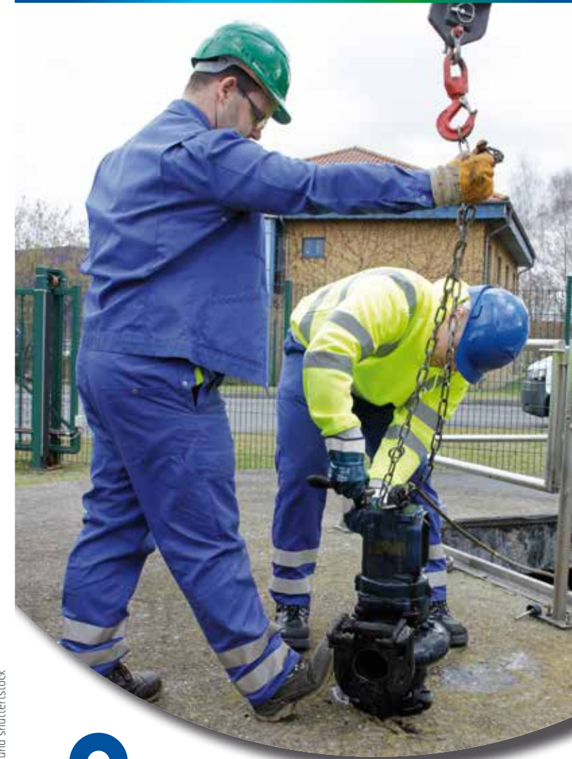
Gestaltung: formbund.de

Personalbüro Köpenicker Straße 25 15711 Königs Wusterhausen Telefon (0 33 75) 25 68-0 E-Mail bewerbung@dnwab.de www.dnwab.de