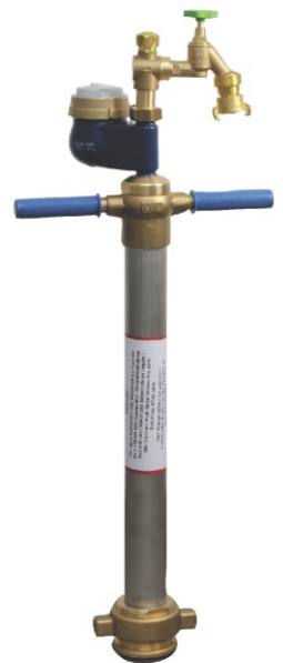
Abb. 3: Standrohr mit Auslaufventil 3/4"