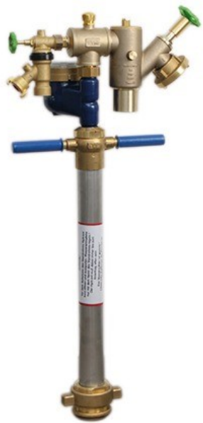
Abb. 2: Standrohr mit Auslaufventil 3/4" und C- Abgang